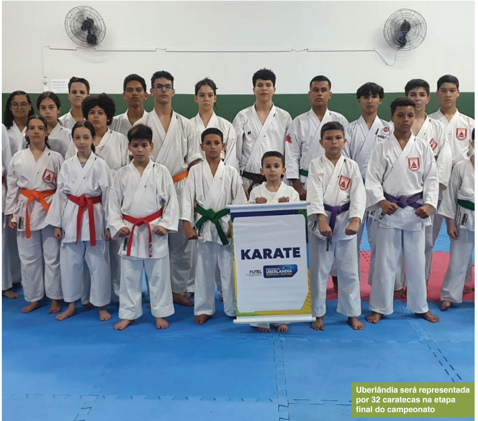
Uberlândia será representada por 32 caratecas na etapa final do campeonato